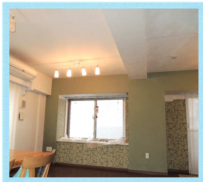
リビングの壁・天井に珪藻土を塗りました