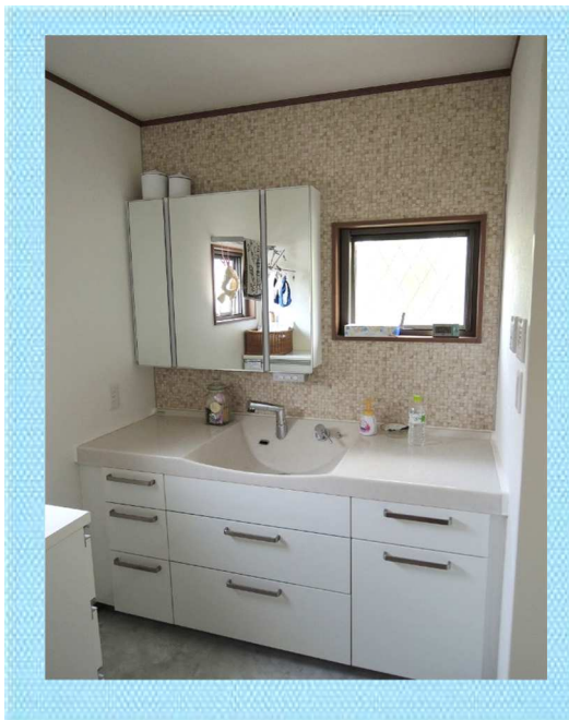
新しい洗面化粧台です。