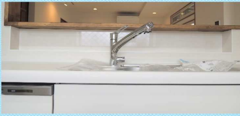
水栓の後ろには小物入れを造りました。