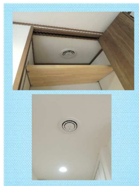
廊下収納の中とキッチン付近2ヶ所にパナソニックのエアイーを設置しました。