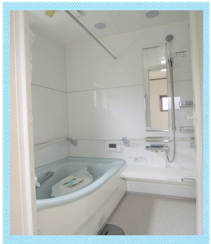
新しいシステムバスです。