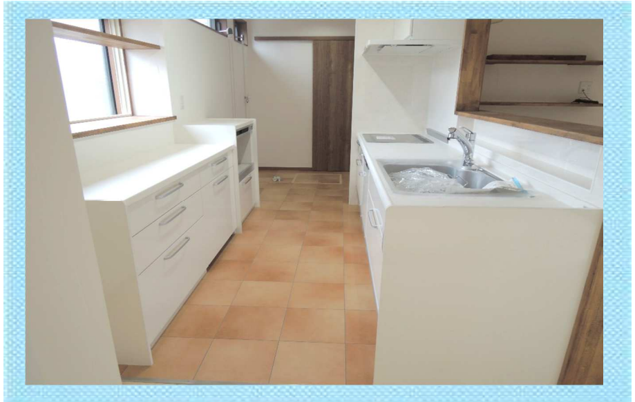
壁付キッチンを対面キッチンにしました。