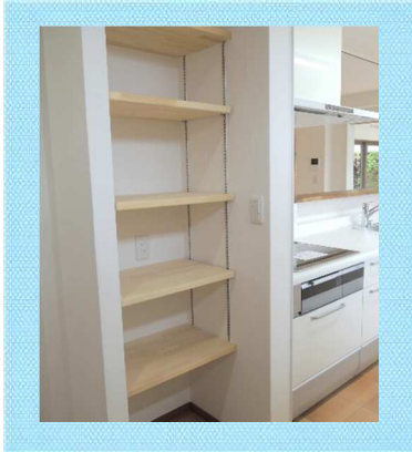
キッチンの隣に収納棚を造りました。