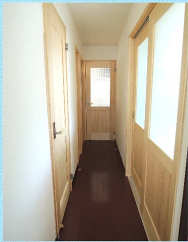
廊下は各扉を新しくして クロスを張替えました。