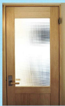
廊下突き当りドアには チェッカーガラスが入っ ています。