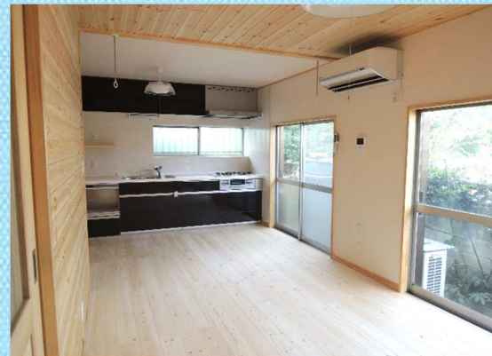
リビング側は総板張りに。ダイニング側は キッチンがある為、防火の事を考え難燃性 かつ汚れ防止のクロスを張りました。