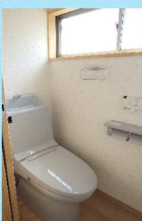
トイレは便器に 色を合わせて クロスのコーデ ィネイト提案 させていただきました。