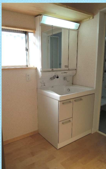
洗面室は、洗面台・クロス・床 全て新しくしました。洗面台の上 には棚も造りました。