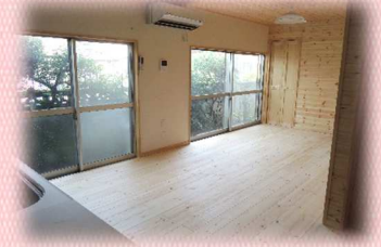
長年住まれたお家の1階 部分をリフォームさせて いただきました。