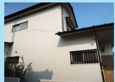
外壁や雨樋などの細部も塗装させてい ただきました。